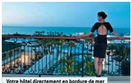
Votre hôtel directement en bordure de mer

Sport et divertissement: Centre de wellness avec sauna, hammam, massages et soins au SPA contre paiement. Gratuit: tennis durant la journée (éclairage contre paiement), studio de fitness et programme d'animations. Payants: divers sports aquatiques sur la plage.