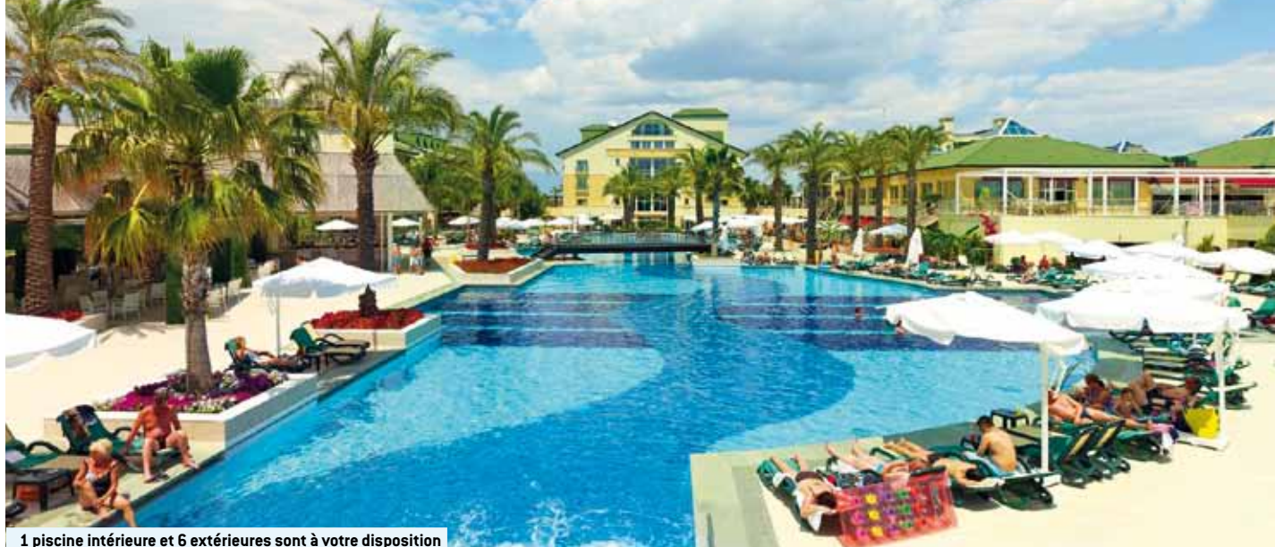
1 piscine intérieure et 6 extérieures sont à votre disposition