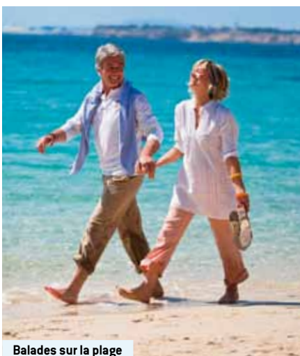
Balades sur la plage