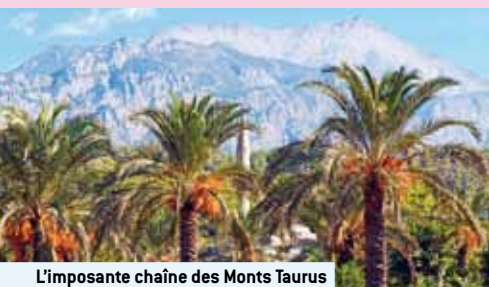
L'imposante chaîne des Monts Taurus