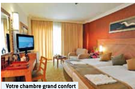
Votre chambre grand confort

3 repas principaux • petit-déjeuner, repas de midi et du soir, au restaurant principal sous forme de buffets • 1 x par séjour dîner dans un restaurant «à la carte» (à réserver) • thé, café et gâteaux dans l'après-midi • boissons, même les boissons alcoolisées locales •