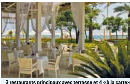
3 restaurants principaux avec terrasse et 4 «à la carte»