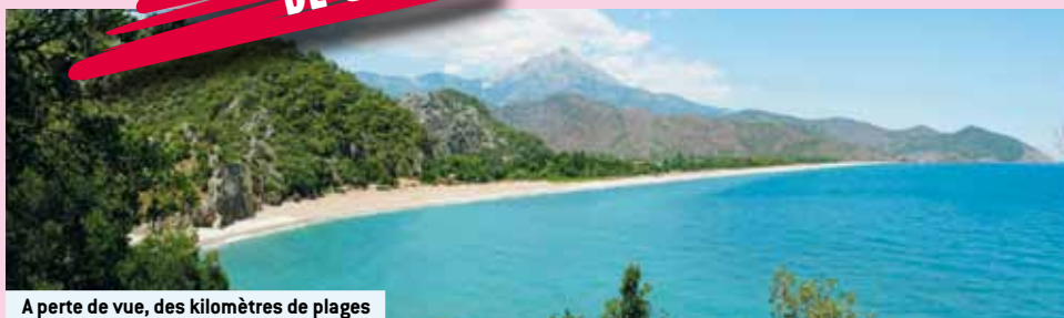
A perte de vue, des kilomètres de plages