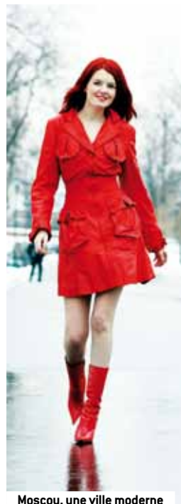
Moscou, une ville moderne