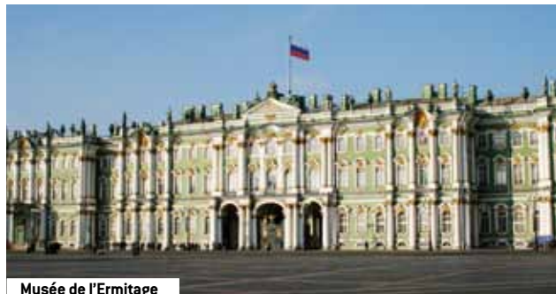
Musée de l'Ermitage