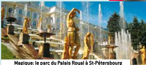
Magique: le parc du Palais Royal à St-Pétersbourg