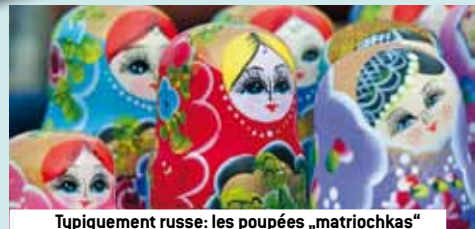
Typiquement russe: les poupées „matriochkas“

*Prix spécial pour réservation anticipée valable jusqu'au 31.10.2012