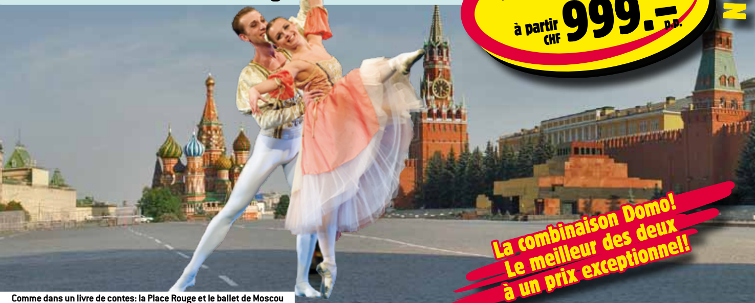
Comme dans un livre de contes: la Place Rouge et le ballet de Moscou

La combinaison Domo! Le meilleur des deux à un prix exceptionnel!