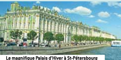
Le magnifique Palais d'Hiver à St-Pétersbourg

La combinaison Domo! Le meilleur des deux à un prix exceptionnel!