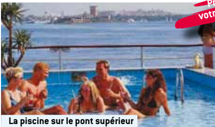
La piscine sur le pont supérieur

Profitez du prix spécial et réservez avant votre départ les excursions de 1 à 5!