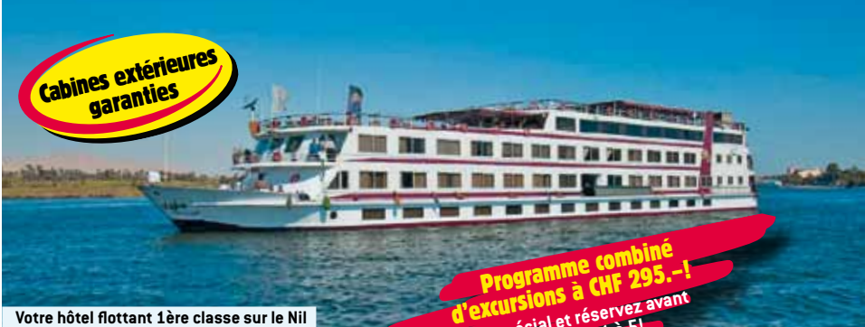
Votre hôtel flottant 1ère classe sur le Nil

8è jour / Assouan et environs: Journée libre.