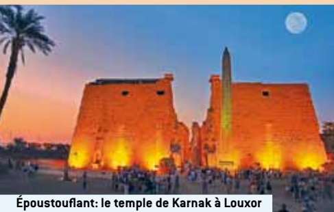
Époustouffant: le temple de Karnak à Louxor