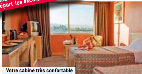
Votre cabine très confortable