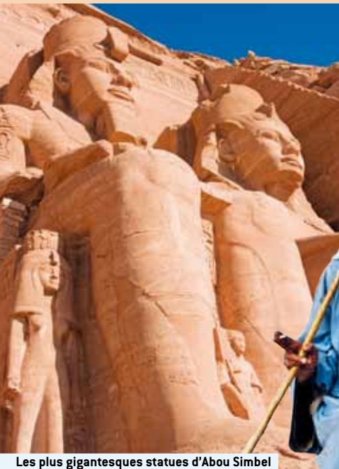
Les plus gigantesques statues d'Abou Simbel