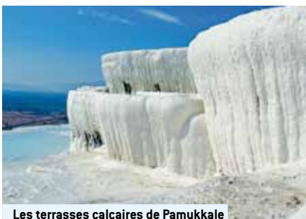
Les terrasses calcaires de Pamukkale

dans l'antique Ephèse. Théâtre, bains thermaux luxueux et une bibliothèque témoignent du bien-être dont a joui cette cité durant plus de 1000 ans. Particulièrement impressionnant, le grand théâtre qui pouvait contenir jusqu'à 25'000 spectateurs.