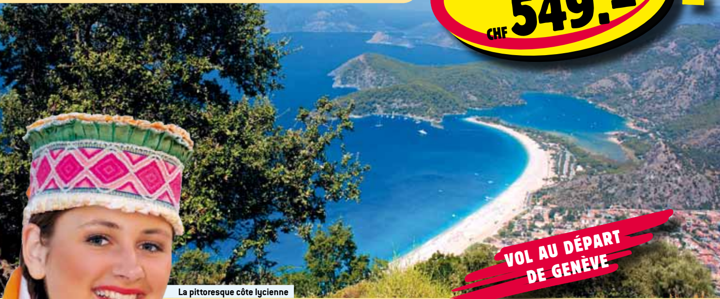
La pittoresque côte lycienne

PRIX D'ACTION 8 jours avec demi-pension dès CHF 549.-