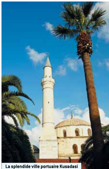
La splendide ville portuaire Kusadasi

4è jour / Ephèse: Ephèse, l'un des plus grands centres mondiaux de fouilles archéologiques gréco-romaines. Peu d'endroits offrent un aperçu aussi vivant de ce que fut jadis le mode de vie