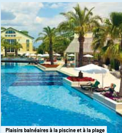
Plaisirs balnéaires à la piscine et à la plage

Vous trouvez à la page 9 de ce catalogue une description détaillée.