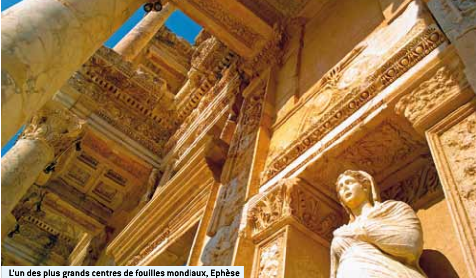
L'un des plus grands centres de fouilles mondiaux, Ephèse