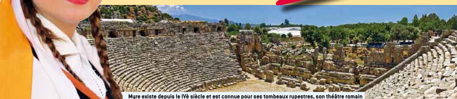
Myre existe depuis le IV e siècle et est connue pour ses tombeaux rupestres, son théâtre romain